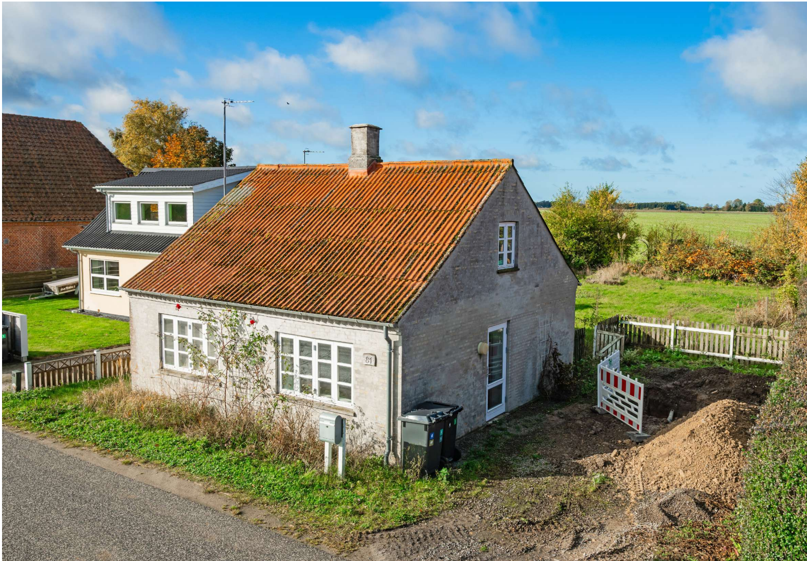
Fritliggende og udlejet 1-familieshus

EJENDOMSMÆGLERFIRMAET JOHN OLE HANSEN SIDEN 1984